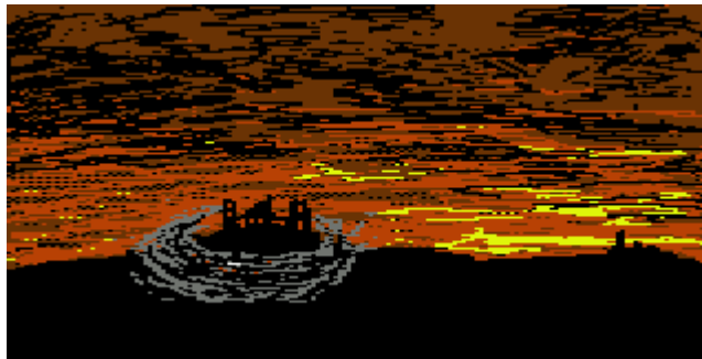
Die Rückkehr in die Gegenwart

Dietrich von Bern versetzte, in tiefstem Schmerz und Zorn über den Verlust der Kampfgefährten, der letzten Burgundin Kriemhild ebenfalls den Todesstoß. Des Blutes und des Mordens überdrüssig, legte ich den Ring der Nibelungen, der mich in diese Zeit zurückversetzt hatte, nach so vielen Jahren ab und wurde wieder ins Heute versetzt. Meine Erinnerung an diese Zeit war jedoch noch lebendig – ebenso wie die Kenntnis über den Aufenthaltsort des Nibelungenhortes!