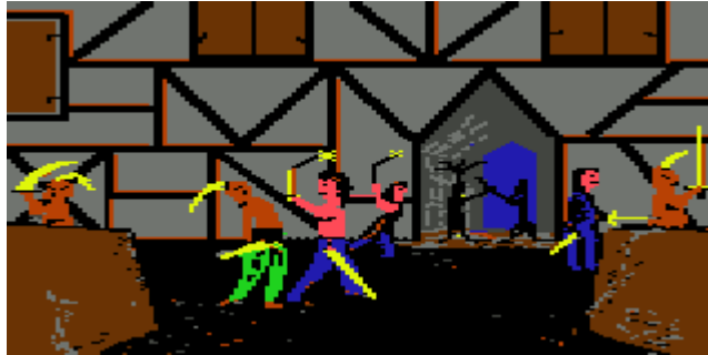
Der Kampf entbrennt

Kriemhild konnte den Bruder Etzels, ihren Schwager Blödelin, mit dem Versprechen eines eigenen Königreiches zum Kampf gegen die Burgunder überreden. Blödelin provozierte beim Essen einen Streit mit den Burgundern. Der Kampf begann, und nur Hagens Bruder Dankwart von Tronje konnte, schwer vom Kampf gezeichnet, aus der Halle entkommen und die Nachricht vom Kampf in den Speisesaal des Hunnenkönigs bringen. Hagen tötete daraufhin, vom Zorn gepackt, Etzels Sohn Ortlieb und erfüllte seine eigene Prophezeiung. Etzel und Kriemhild konnten Hagens Zorn lediglich deshalb entkommen, weil sie Dietrich von Bern bei ihrer Flucht schützte.