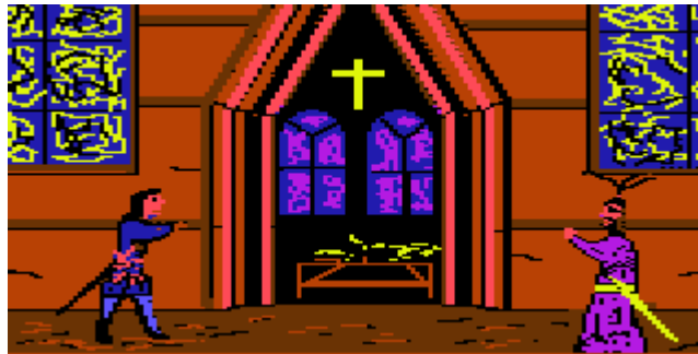
Eine Rast während der Brautfahrt

Volker von Alzey führte den Zug der Burgunder weiter in Richtung Osten. Bischof Pilgrim bewirtete die Reisenden unterwegs.