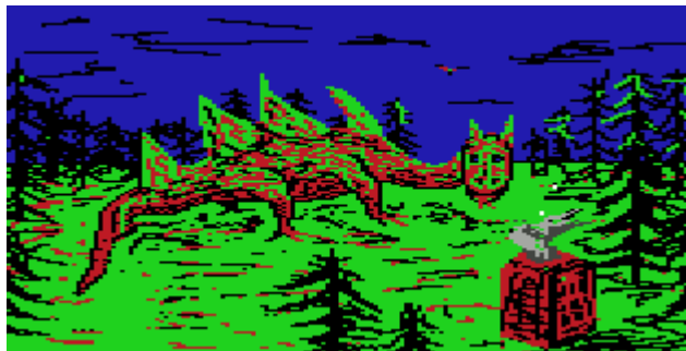
Der gar schreckliche Drache muss besiegt werden!

Im von Mime bezeichneten Gebiet wimmelte es nur so von Kröten, Drachen und anderem Getier. Einen der Drachen töteten wir mit unseren Schwertern. Dies war einigermaßen einfach zu bewerkstelligen, jedoch mussten wir bei Fafnir, dem Urdrachen, all unseren Mut zusammennehmen. Wir wussten, dass Fafnir nur am Bauch verwundbar war, und stießen dem Drachen unsere Schwerter in den Leib. Daran anschließend badeten wir in seinem Blut.