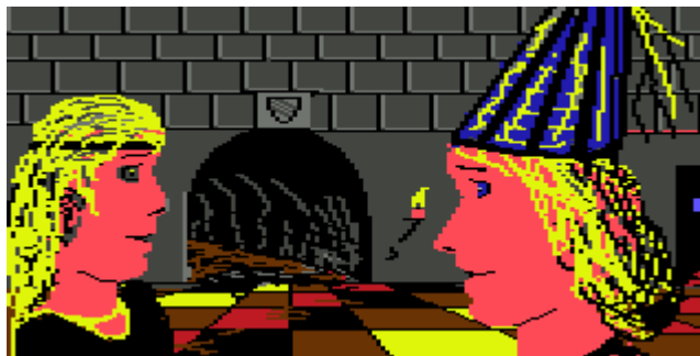
Die Braut möchte mit ihrem richtigen Namen angesprochen werden ...

Ungefähr sechs Wochen nach der Odenwälder Schlacht, während der Pfingstzeit, traf Siegfried im Verlauf eines Festes Kriemhild zum ersten Mal. Mir wurde die Ehre zuteil, die holde Maid Kriemhild zu Siegfried führen zu dürfen. König Gunther gab die Verlobung der beiden bekannt und schenkte den gefangenen Königen Lüdeger und Lüdegast aus diesem Anlass die Freiheit.