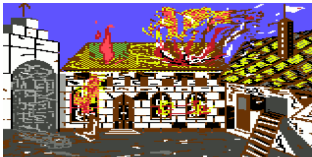
Kriemhild lässt Feuer legen

Als die Burgunder, vom Kampf ermattet, darum baten, die Kämpfe im Freien ausfechten zu dürfen, verweigerte ihnen Kriemhild diese Bitte. Sie versprach jedoch, die Kämpfe abubrechen, wenn die Burgunder ihnen den Mörder Siegfrieds, Hagen von Tronje, auslieferten. Da sich Gunther weigerte, seinen treuesten Lehensmann preiszugeben, ließ Kriemhild die Halle anzünden. So hatten die Burgunden gegen zwei Feinde zu kämpfen: Gegen die Hunnen und gegen das Feuer. Rüdiger von Bechelaren versuchte noch einmal, zwischen den verfeindeten Parteien zu vermitteln. Kriemhild lehnte dessen Ansinnen jedoch ab und erinnerte ihn an seinen Wormser Eid, der ihn zwang, nun selbst gegen die Burgunden in die Schlacht zu ziehen – und dies, obwohl er seine Tochter mit dem jüngsten Burgunderkönig verlobt hatte, als dieser bei ihm zu Gast war! Schweren Herzens trat Rüdiger gegen Gernot, neben Gunther und Giselher der dritte der Burgunderkönige, an. Beide starben.