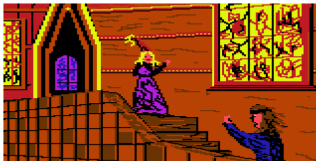
Der Streit der Königinnen

Die Wiedersehensfreude war groß, jedoch gerieten die beiden Königinnen Brunhild und Kriemhild miteinander in Streit. Während Brunhild meinte, dass Siegfried Lehensmann Gunthers sei und demnach zinspflichtig sei, behauptete Kriemhild, Siegfried sei der eigentliche Bezwingler Brunhilds in der Hochzeitsnacht gewesen. Da Brunhild Beweise dafür verlangte, legte Kriemhild Brunhilds Armreif und ihren Gürtel vor. Obwohl Siegfried daraufhin schwor, dass nicht er Brunhild bezwungen habe (eigentlich war ich es ja gewesen...), ist Brunhild tief gekränkt. Hagen, der erste Lehensmann Gunthers, schmiedete daraufhin mit Brunhild ein Komplott gegen Siegfried, um Rache zu nehmen.